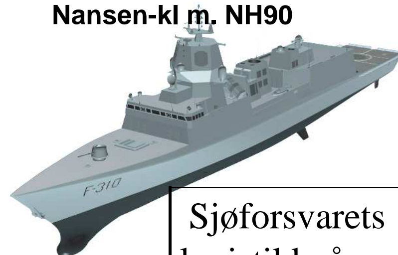
Nansen-kl m. NH90